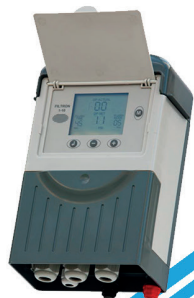
Controlador Retrolavado Filtron

Disponible con certificación norma Chilena.